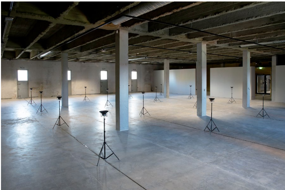
Kuva 1: Elämänasennot puutarhassa Odotustila Seinäjoen taidehallilla Gustafsson&Haapojan Siat -näyttelyssä.

(Et) ja Nimetön (Elossa) (N (E)) asettuvat sisäänkäynnin molemmin puolin, kun suurimman osan näyttelyn pinta-alasta vievästä Odotustila -ääni-installaatiosta (Ot) kantautuvat äänekkäät röhkeet 5 kiinnittävät huomion. Teoksen esillepanossa käytettyjen vähäeleisten kaiuttimien muodostelma toistaa äänitystilannetta suomalaisella sikatilalla: jokainen kaiutin on ikään kuin oma karsinansa, josta kuuluu eri ääni. Teoksen 12-minuuttisen ääninauhan aikana kuullaan erilaisia röhkeitä, kirkunaa, sikojen liikehdintää, ruokintalaitteiden ääntä ja sikojen parissa työskentelevän ihmisen puhetta. Vaikka äänitys kuvastaa melko tavallisia sikalan ääniä, temaattisesti Ot liittyy sikojen kuolemaan ja tappamiseen: näyttelytekstissä kerrotaan lähestyvistä teurastuksesta.