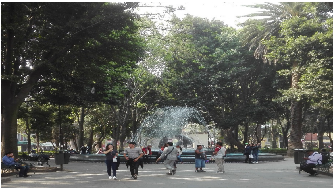
Aukio Coyoacánin alueella.

Kestoltaan konferenssi oli pitkä: se kesti kuusi kokonaista päivää, joista yksi oli vapaapäivä. Pitkät päivät koet- telivat osallistujien jaksamista, mutta onneksi vapaahetkinä saattoi tutustua kaupunkiin. Méxicon kaupunkiseutu on maailman kolmanneksi suurin, ja yli 22 miljoonaa ihmistä asuu suur-Méxicon alu- eella. Vaikka kaupunki on yksi maailman saastuneimpia, ei ilma tuntunut siellä ta- vattoman huonolta. Ilmanlaatua onkin yritetty parantaa 1990-luvulta lähtien. Kaupunki oli myös vihreämpi kuin odotin. Ihmisten lisäksi muita eläimiä huomasi kaupunkitilassa vähän, lähinnä ihmisten