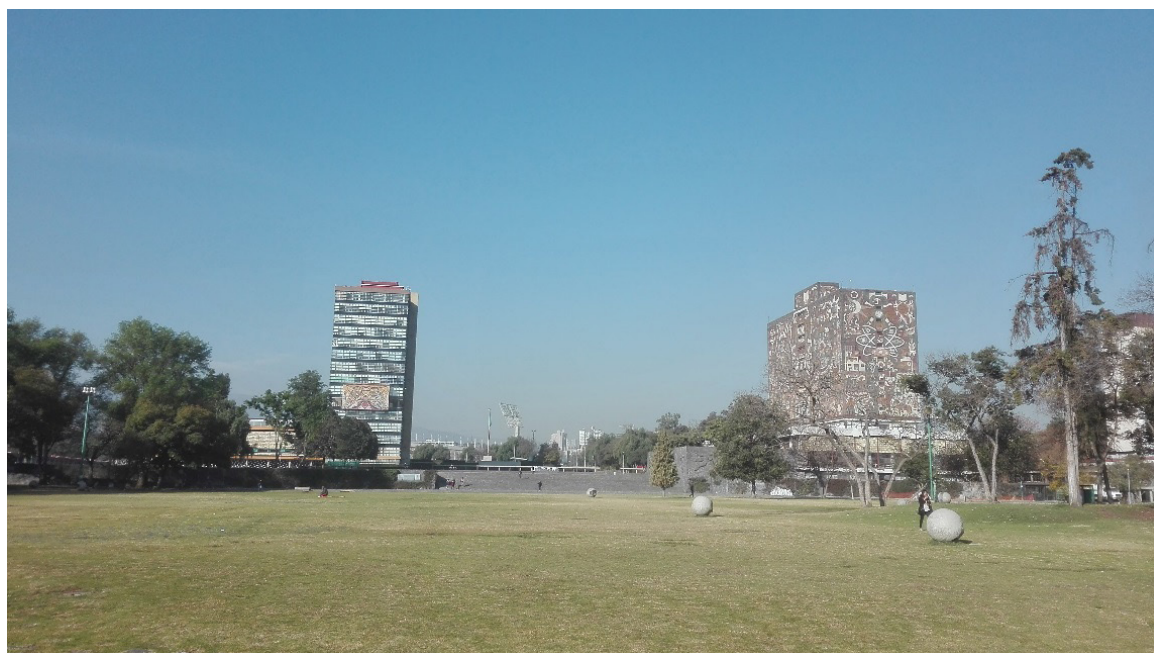
UNAMin kampusaluetta.

moni esitys peruuntui sairastapausten ja muiden esteiden takia. Erityisesti harmitti isojen nimien Bruno Latourin ja Donna Harawayn luentojen peruuntuminen. Peruutuksista huolimatta lähes viikon kestäneessä konferenssissa oli runsaasti kuultavaa. Pitkät päivät täyttyivät kiinnostavista sessioista ja paneeleista, dokumenttinäytöksistä, taide-esityksistä, iltaohjelmasta ja muiden osallistujien kanssa