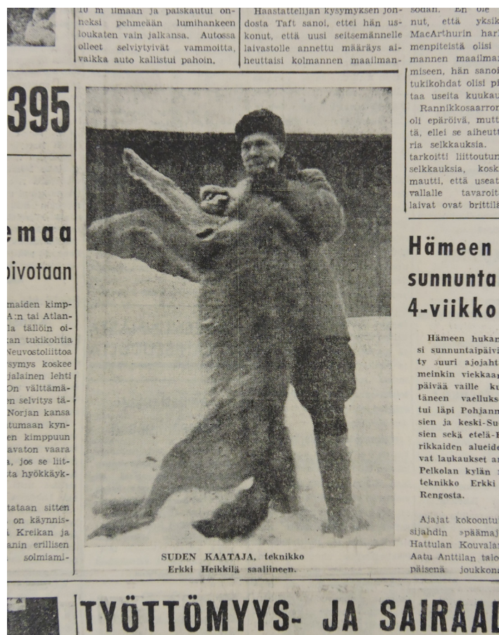
Kuva 2: ”Susirajan” väärällä puolella, Hämeen seudulla alkuvuonna 1953 tavattu susi tapettiin helmikuussa ison jahdin päätteeksi. Lähde: Hämeen susi tapasi kohtalonsa sunnuntaina Hattulan metsässä 4-viikkoisen ajojahdin jälkeen, Hämeen Sanomat 10.2.1953, 1.

ajoin, olivat määrät huomattavasti pienempiä kuin ennen kannanromahdusta. Ajan myötä susien vähälukuisuus muuttui normiksi. Susien vähälukuisuus ei kuitenkaan johtunut susien ihmisistä riippumattomasta valinnasta pysyä poissa, sillä ihmiset tappoivat susirajan väärälle puolelle tulleita susia. Näin kävi esimerkiksi Liedossa loppuvuonna 1920 ja Hämeen seudulla 1950- ja 1970-lukujen alussa liikkuneille susille. Näiden susien sijoittumisen ei-toivottavuus ilmeni tavoissa, joilla