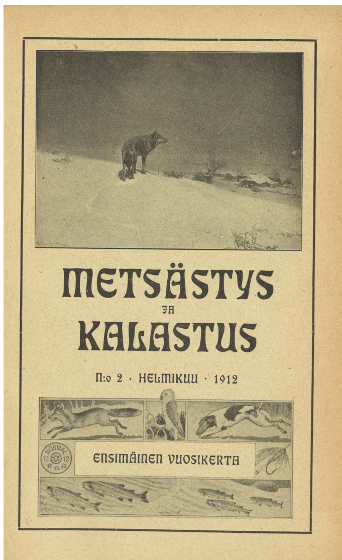
Kuva 3: 1900-luvun alkupuolen kuvituskuivissa susi kuvattiin ihmisen lähelle, kulttuurimaisemaan tulevana lajina. Metsästys ja Kalastus -lehden helmikuun numeron kannessa komeili jäljennös puolalaisen taiteilijan Alfred von Wierusz-Kowalskin vuonna 1900 maalaamasta Samotny Wilk eli Yksinäinen susi -nimisestä maalauksesta.

Tarkastelin myös susien liikkumista ja elämistä suhteessa ihmisen elinpiiriin. Aineistojeni mukaan sudet ovat liikkuneet lähellä ihmisiä, ja läheisyydestä on voinut olla niille hyötyä esimerkiksi ravinnonsaannin kannalta. Kuitenkin mielikuvat sudesta erämaalajina ja pihoilla käyvistä susista häirikkösusina ovat nykyään vahvasti voimassa. Lähdin tutkimaan näitä käsityksiä ja havaitsin myös niiden syntyneen Suomessa vasta 1900-luvun aikana. Vielä vuosisadan alussa esitettiin susien tuleminen ihmisten lähelle osin ikävänä mutta tavallisena asiana; eläintietokirjojen ja